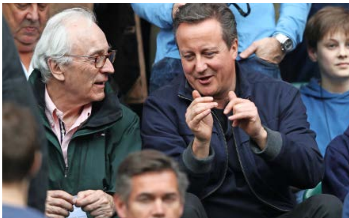
Privatier David Cameron hat nun reichlich Zeit für den Besuch von Fussballspielen. Er gilt als Anhänger von Aston Villa.

Ursprünglich hätte das Buch schon vergangenes Jahr herauskommen sollen, doch Cameron wollte nicht in den Verdacht geraten, als Politfrührentner noch ins Tagesgeschehen eingreifen zu wollen. Überhaupt hält er sich seit seinem Auszug aus 10 Downing Street bedeckt; Cameron hatte am 24. Juni 2016 seinen Rücktritt angekündigt, einen Tag nach der Niederlage im Referendum; er gab auch seinen Sitz im Unterhaus auf, den er mit 35 Jahren geholt hatte. Zuvor hatte er erklärt, das Resultat des Referendums umsetzen zu wollen, egal ob «remain» oder «leave».